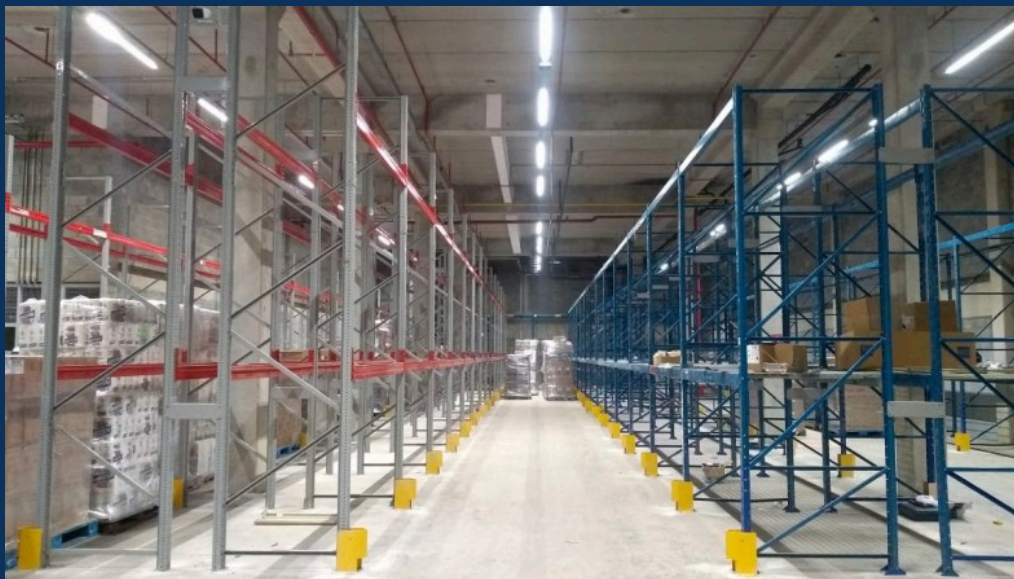
MONTAGEM DE ESTRUTURA APÓS REVISÃO DE ITENS DO PAR