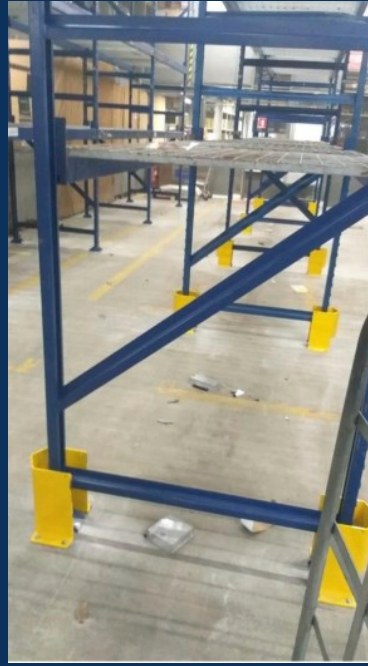
PROTETOR DUPLO DE COLUNA DEVIDO A ROTA DE CIRCULAÇÃO DE EMPILHadeira