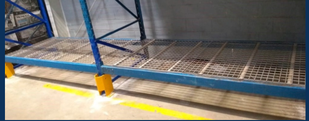
APLICAÇÃO DE PROTETOR DE COLUNA