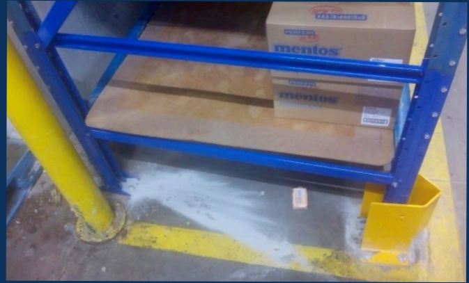
TROCA PARCIAL DAS COLUNAS, SUBSTITUIÇÃO DE CONTRAVENTAMENTOS E APLICAÇÃO DOS PROTETORES DE COLUNA DE 300MM